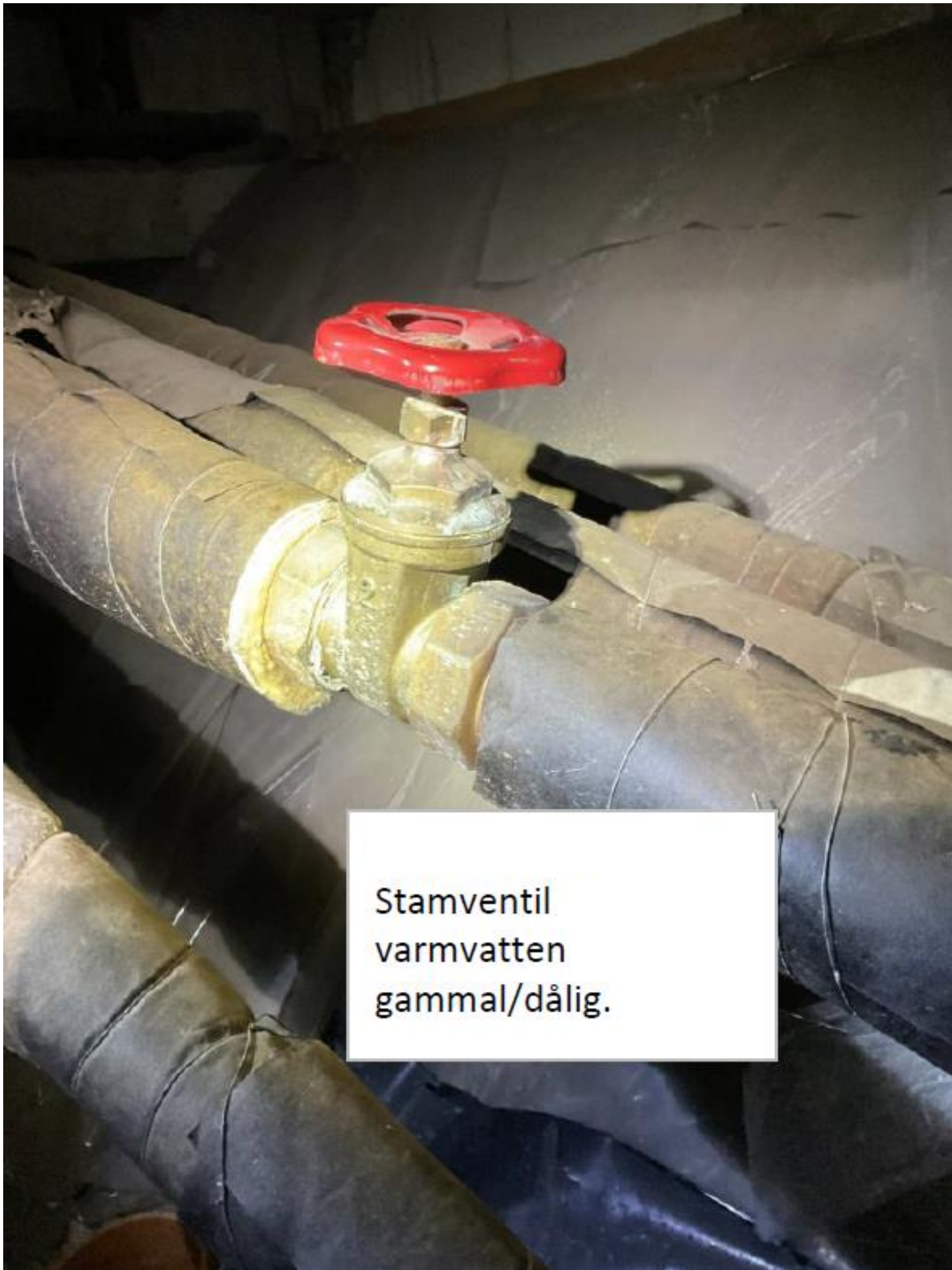
Stamventil varmvatten gammal/dålig.