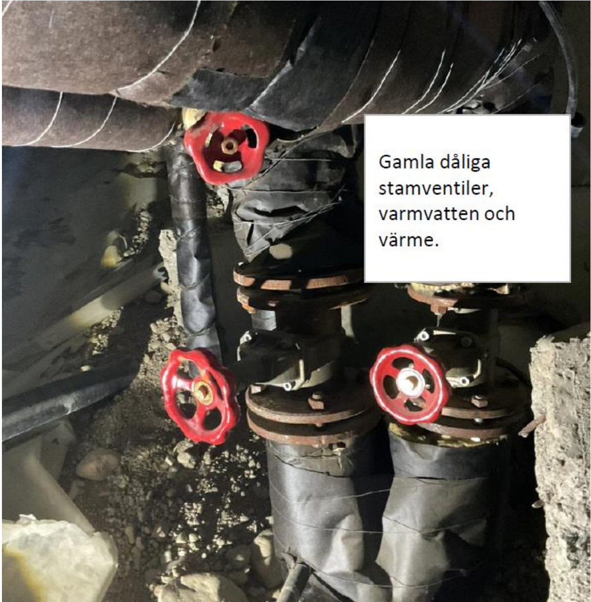
Gamla dåliga stamventiler, varmvatten och värme.