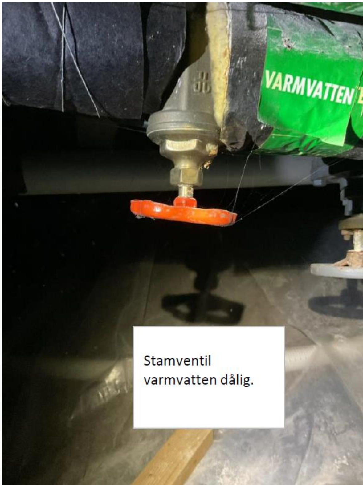
Stamventil varmvatten dålig.