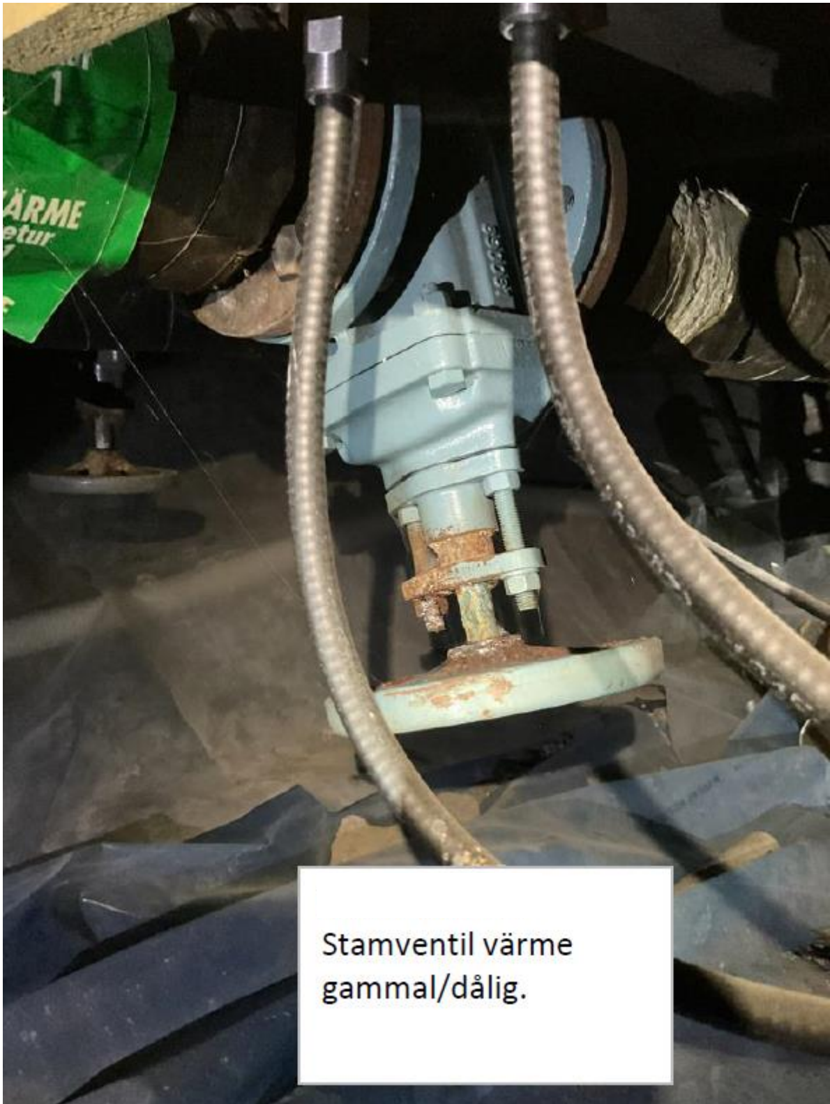
Stamventil värme gammal/dålig.