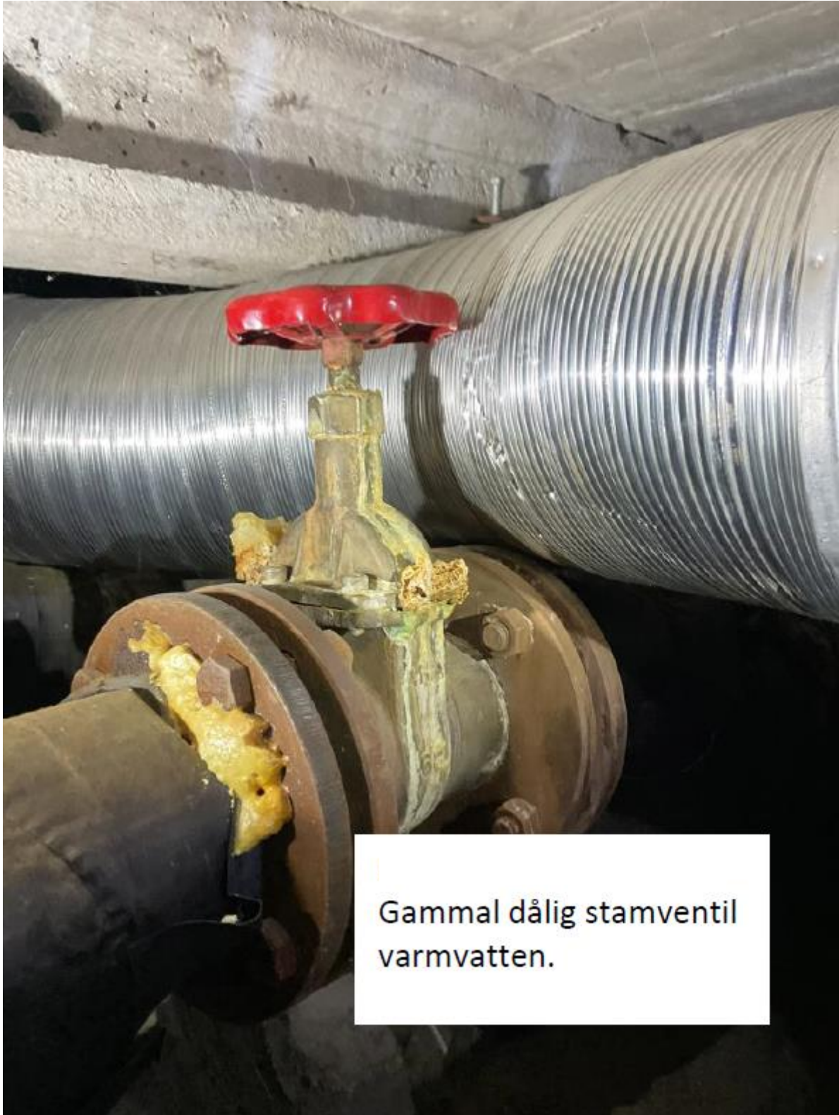
Gammal dålig stamventil varmvatten.